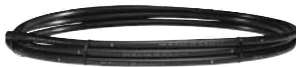
Super Funny Pipe

Toro super funny pipe è una tubazione in polietilene molto resistente appositamente studiata per risolvere i problemi di installazione di irrigatori dovuti a complicati, ma indispensabili, posizionamenti e sostituzioni. Semplice da utilizzare, funge da prolunga flessibile di collegamento tra la linea idrica e gli irrigatori, permettendo la collocazione di quest'ultimi nella posizione più idonea nell'ottica dell'omogeneità dell'irrigazione, la soluzione definitiva a problemi legati a posizionamenti difficili e complicati.