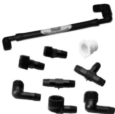
Raccordi per Super Funny Pipe

Questa tubazione, unica nel suo genere, si comporta come una prolunga che permette di posizionare gli irrigatori esattamente nel posto desiderato. Con questo sistema anche l'installazione degli irrigatori Hi-Pop con torretta ad elevata escursione risulta facile anche nelle ubicazioni più difficili e disparate.